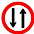
Duplo sentido de circulação