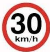
Velocidade Máxima Permitida